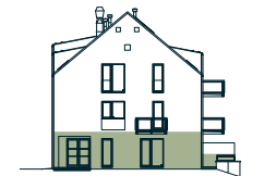
pohled západní western view