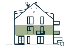
pohled západní western view