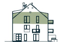
pohled západní western view