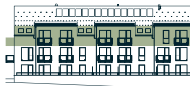
pohled jižní southern view