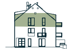
pohled západní western view