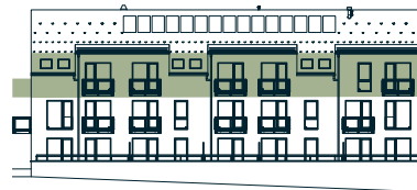
pohled jižní southern view